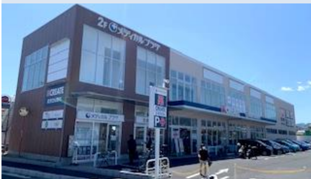
1階には地域最大級のドラッグストアCREATEが出店