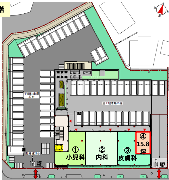
クリニック区画 2階