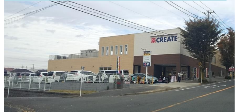
1階にはドラッグストアCREATEが出店 ※建物画像はイメージです