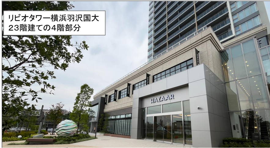
リビオタワー横浜羽沢国大 23階建ての4階部分