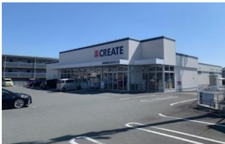
同敷地内にするクリエイイト長泉東中土狩店