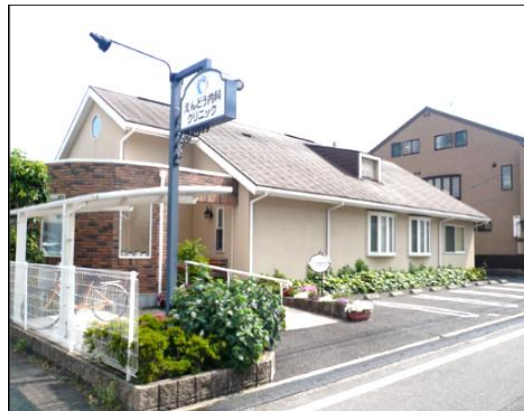
【近隣のえんどう内科クリニック】