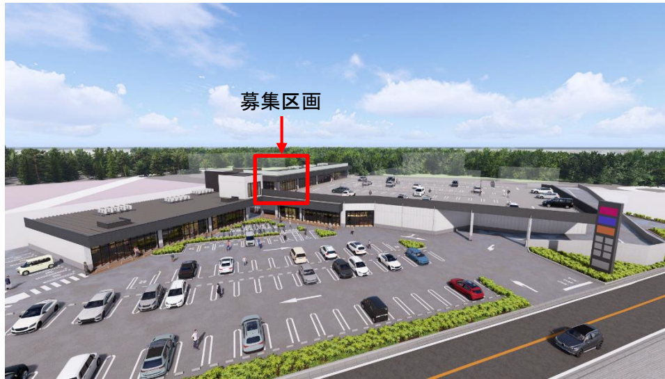
【アクロスプラザ昭島 完成イメージ】