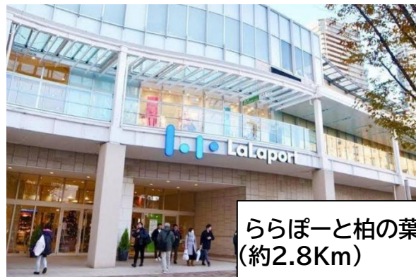
ららぽーと柏の葉 (約2.8Km)