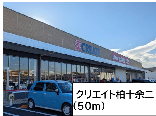
クリエイト柏十余二 (50m)