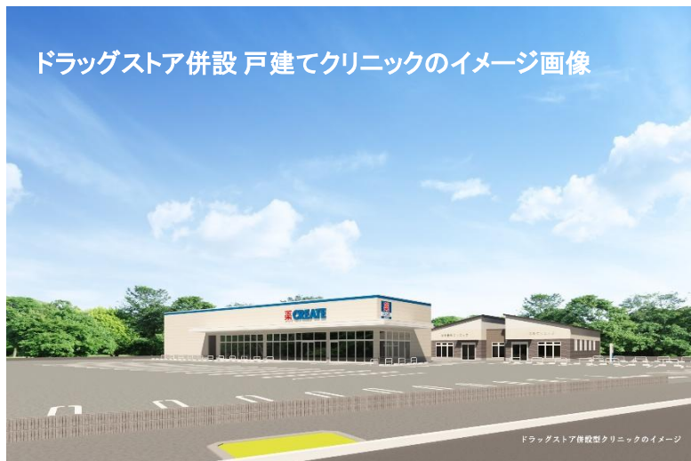
ドラッグストア併設型クリニックのイメージ