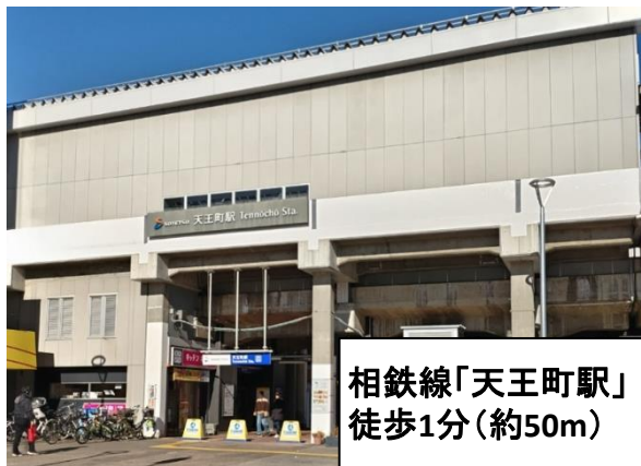
相鉄線「天王町駅」 徒歩1分(約50m)