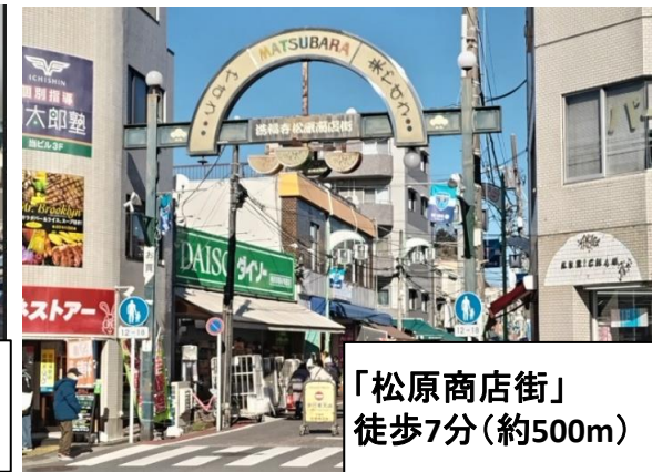
「松原商店街」 徒歩7分(約500m)