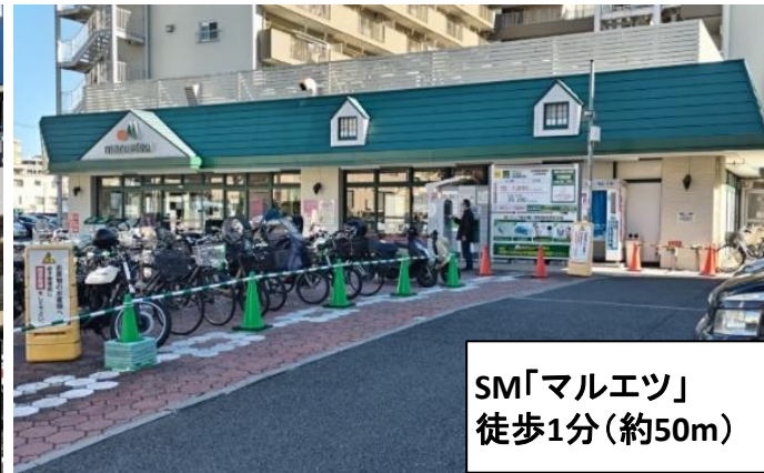
SM「マルエツ」 徒歩1分(約50m)