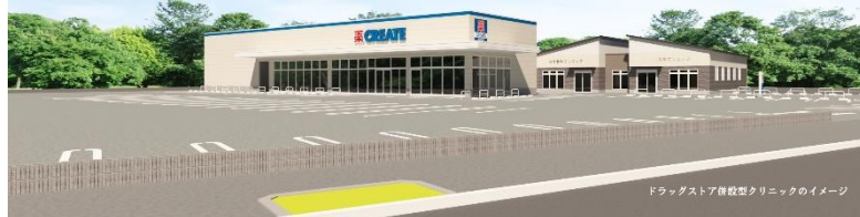
ドラッグストア併設 戸建てクリニックのイメージ画像